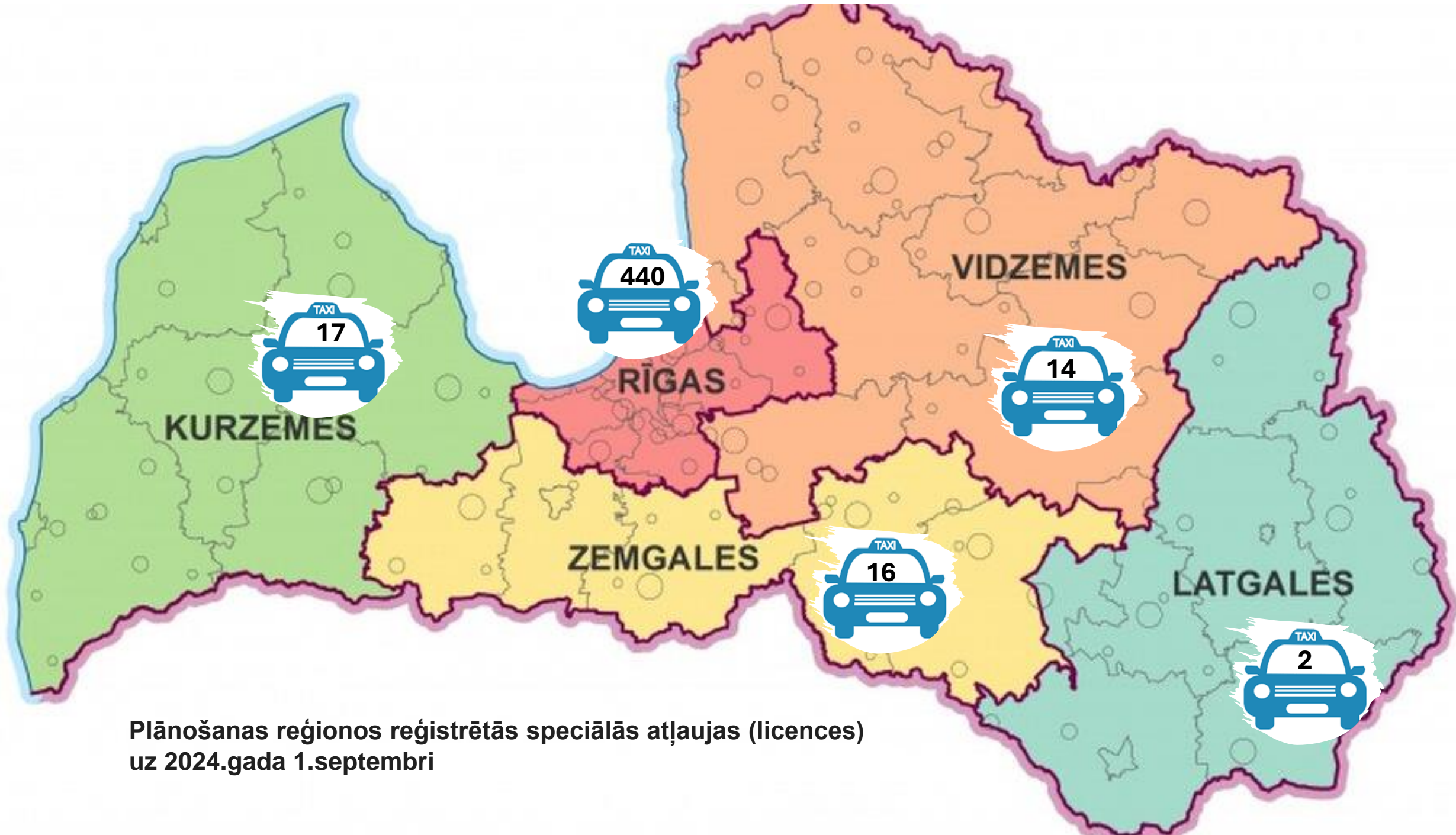
Plānošanas reģionos reģistrētās speciālās atļaujas (licences) uz 2024.gada 1.septembri