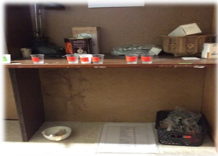
Saimniecības telpa Centrā, kurā bija uzglabātas iemītniekiem paredzētās zāles (2024. gada 6. aprīlis)